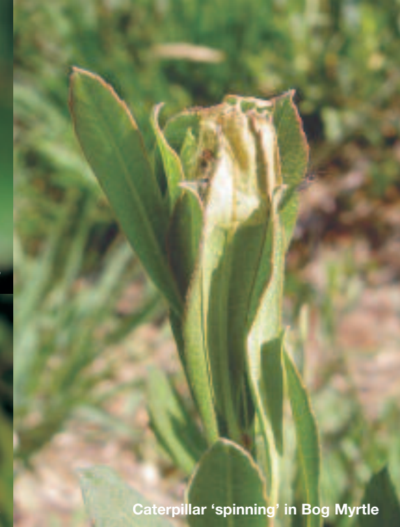
Caterpillar 'spinning' in Bog Myrtle