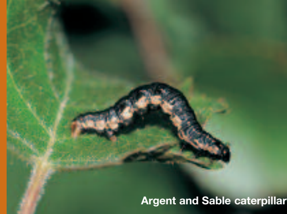
Argent and Sable caterpillar

Mae Llywodraeth y DU wedi rhestru'r Arian a Du yn Rhywogaeth Flaenoriaethol dan Gynllun Gweithredu Bioamrywiaeth y DU, sy'n golygu bod angen dybryd gweithredu i'w achub.