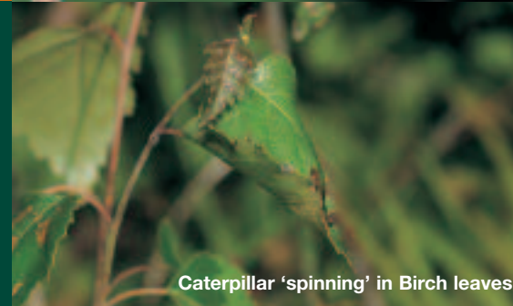
Caterpillar 'spinning' in Birch leaves