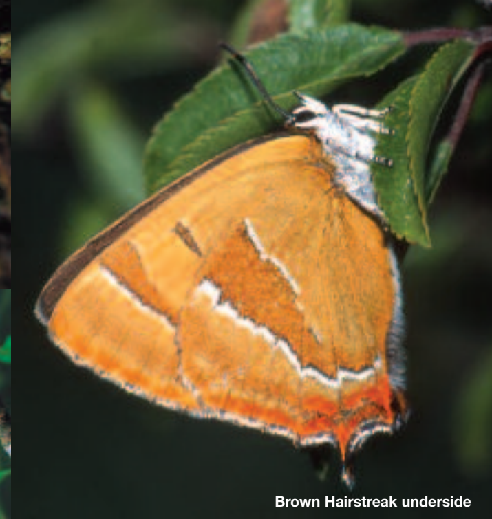
Brown Hairstreak underside