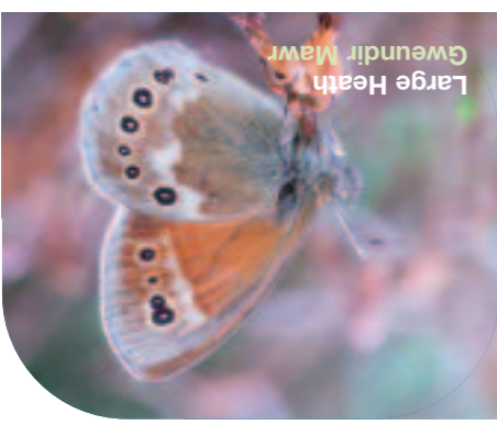
Large Heath Gweundir Mawr

To ascertain the current distribution of UK BAP Priority Butterflies on Forestry Commission Wales forests and woodlands, Butterfly Conservation was contracted to undertake a 'Priority Butterflies Survey' targeting those species at sites with previous records. At some sites fuller Lepidoptera surveys were undertaken including moth trapping. >>>>