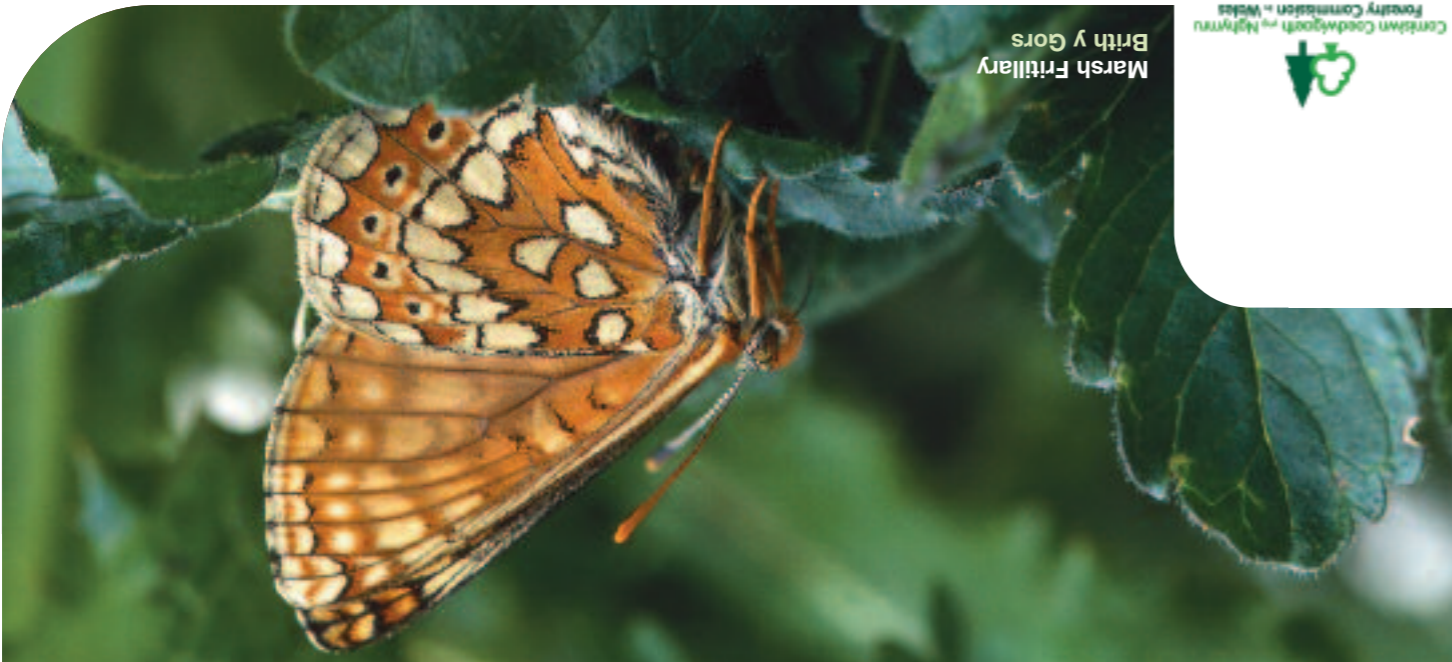
Marsh Fritillary Brith y Gors

The Forestry Commission's 'Species Action Plan for Butterflies on Forestry Commission Land 2000-2005' outlined the Commission's commitment to the conservation of the UK BAP priority butterflies and butterflies in general on Forestry Commission sites throughout the UK.