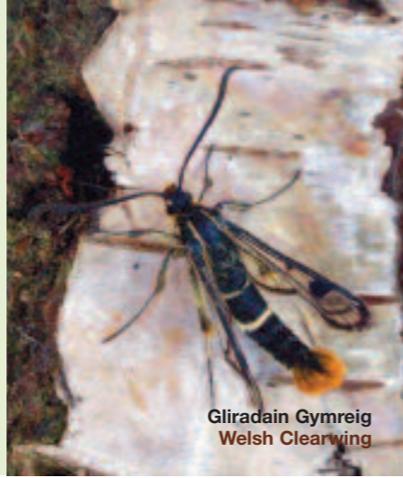
Gliradain Gymreig Welsh Clearwing