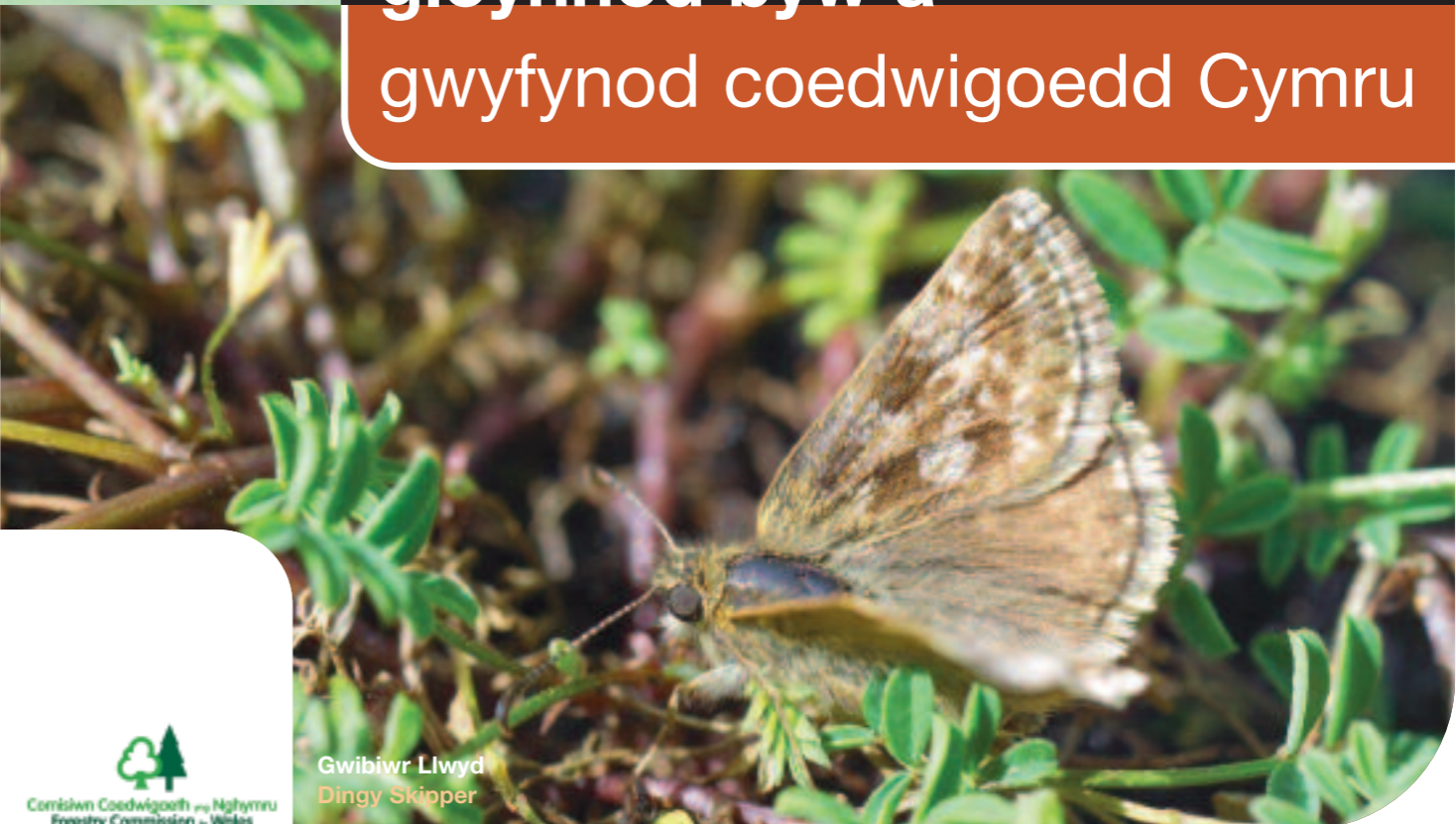
Gwibiwr Llwyd Dingy Skipper