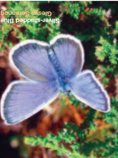
Glesyn Serennog Silver-studded Blue

Over a four-year period (2001 - 2004), 56 Forestry Commission Wales forests and woodlands were surveyed by Butterfly Conservation staff, volunteers and contractors. Site surveys targeted the flight periods of butterflies accorded Medium and High Priority in Butterfly Conservation Wales' National Action Plan (NAP). Sites were also checked for other priority species if the habitat appeared suitable. At some sites moths were also recorded by light trapping.