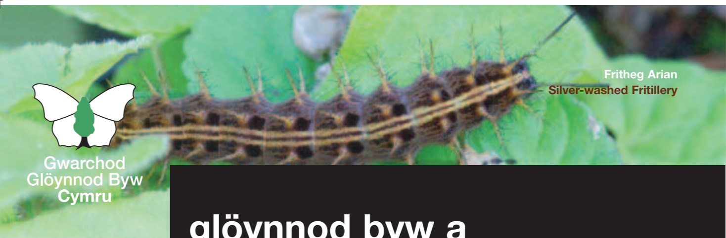
Fritheg Arian Silver-washed Fritillery