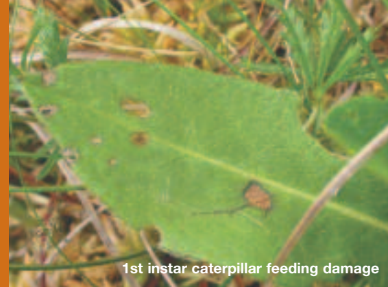
1st instar caterpillar feeding damage

Mae Llywodraeth y DU wedi ei restru'n Rhywogaeth Flaenoriaethol dan y Cynllun Gweithredu Bioamrywiaeth, sy'n golygu bod angen dybryd gweithredu i'w achub.