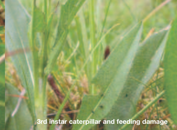
3rd instar caterpillar and feeding damage