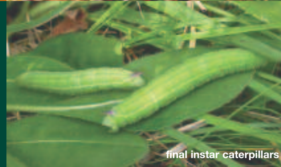
final instar caterpillars